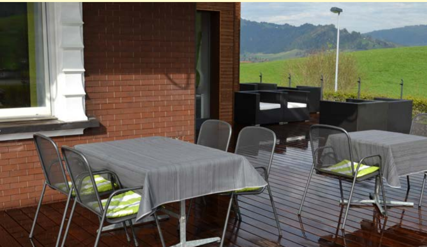
Neue, erweiterte Aussenterrasse