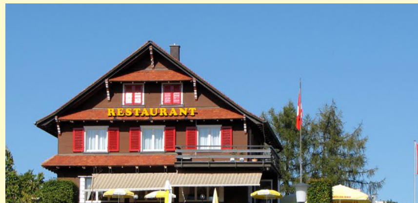
Restaurant Lincoln, 2015

Von 14.00 - 18.00 Uhr begrüssen wir Sie zur freien Besichtigung und einem Begrüssungs-Apero.