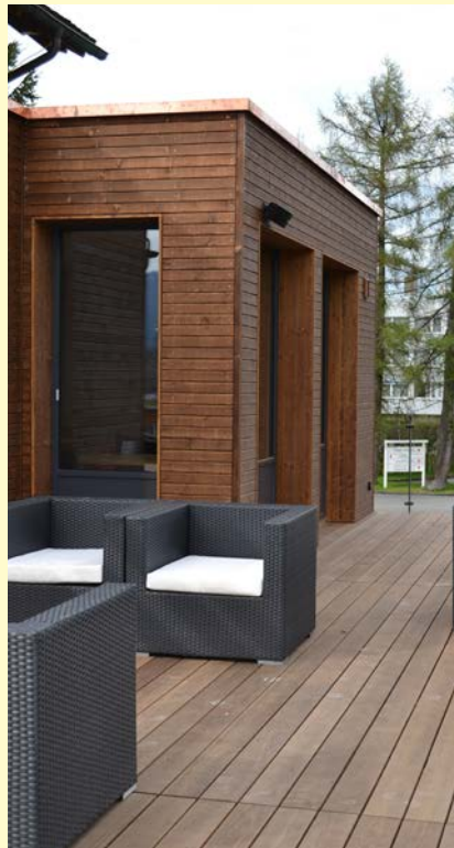
Loungebereich mit Anbau „Chalet“

Bauherrschaft: Lincoln Invest AG Architekt: HPK Architekten AG, Hanspeter Kälin & Partner