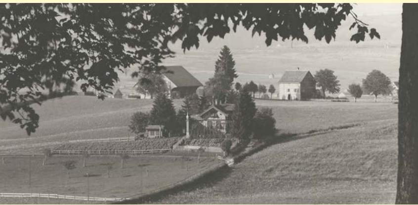
Ehemaliges „Chalet Lincoln“, 1925