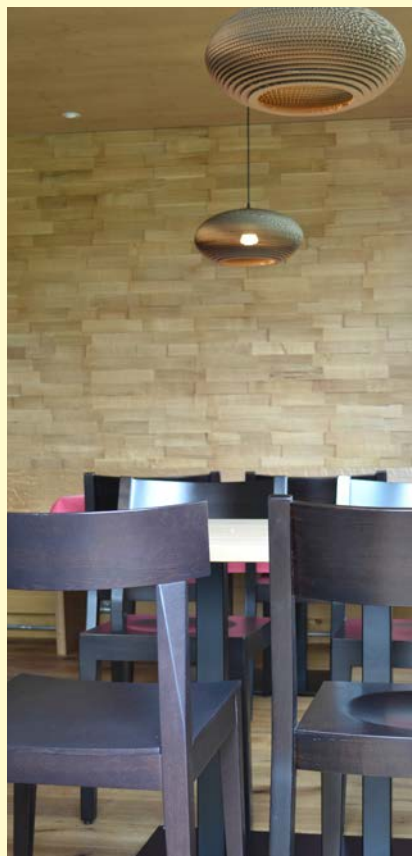
Innenansicht Anbau „Chalet“

Bauherrschaft: Lincoln Invest AG Architekt: HPK Architekten AG, Hanspeter Kälin & Partner